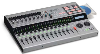
Multipiste Zoom HD16

Cet aménagement instrumental est le cœur du Centre d'Expérimentation sur la Parole car il est à l'origine d'une importante masse de données et de corpus utilisés dans les travaux du laboratoire.